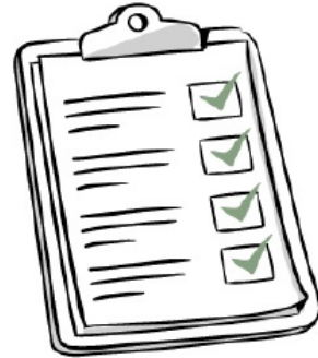
Identifying needs & fostering dialogue