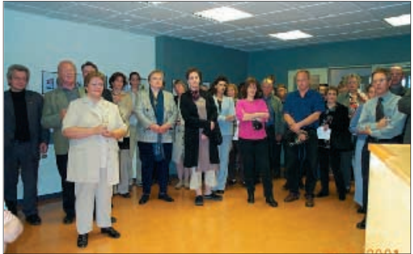
Fjöldi manns var viðstaddur opnunina