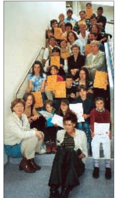
Að loknu íslenskunámskeiði

varðandi móttöku á flóttamönnum. Tekið hefur verið á móti hópum flóttafólks frá fyrrum Júgóslavíu allt frá árinu 1996 og er fjöldi þeirra sem hingað hafa komið frá fyrrum Júgóslavíu 192 einstaklingar. Verkefnið hafa heppnast einstaklega vel og hefur meginhluti þeirra sem hingað hafa komið sest að hér á landi og aðlagast landi og þjóð vel. Sá árangur sem náðst hefur á síðastliðnum árum í móttöku flóttamanna hefur byggst á góðri samvinnu félagsmálaráðuneytisins, flóttamannaráðs, viðkomandi viðtökusveitarfélaga, Rauðakrossdeildanna í viðkomandi sveitarfélögum og Rauða kross Íslands.