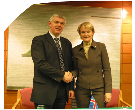
Magnús Stefánsson félagsmálaráðherra og Valgerður Sverrisdóttir utanríkisráðherra.

Móttaka Íslendinga á flóttamönnum hefur vakið athygli á vettvangi Flóttamannastofnunarinnar sem hefur óskað eftir samstarfi við Íslendinga þar sem verklag sem beitt hefur verið hér þykir til fyrirmyndar.