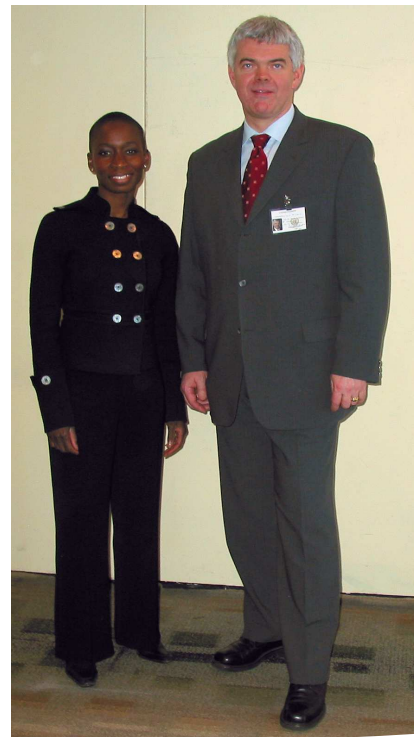
Nyamko Sabuni og Magnús Stefánsson, ráðherrar jafnréttismála á Íslandi og í Svíþjóð, á fundi norræna jafnréttisráðherra í höfuðstöðvum Sameinuðu þjóðanna í New York.