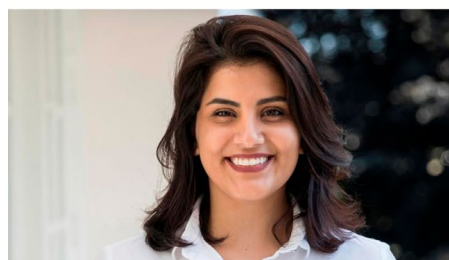
Jailed Saudi women's rights activist Loujain al-Hathloul is seen in this undated handout picture

Today, Saudi Arabia once again committed to abolishing the male guardianship system.