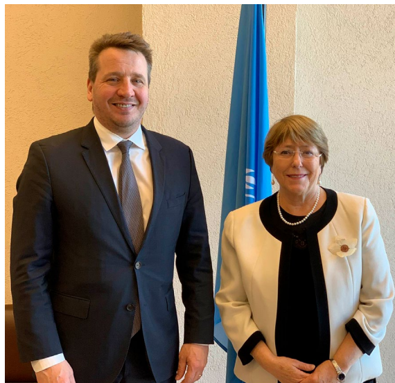
Frá fundi Guðlaugs Þórs Þórðarsonar utanríkisráðherra með Michelle Bachelet, mannréttindafulltrúa Sameinuðu þjóðanna, í Genf 2019

Megininntak þeirrar vinnu sem felst í setu í mannréttindaráðinu byggist á því að fylgjast með mannréttindamálum, bera kennsl á mannréttindabrot ríkja og móta afstöðu til þeirra. Ráðið fjallar einnig um ástand mannréttinda í einstökum aðildarríkjum SP með áður nefndri allsherjarúttekt, eða UPR-ferlinu, og fara þrjár