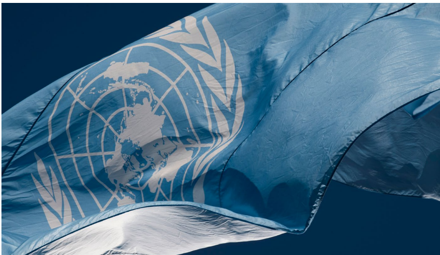
Fáni Sameinuðu þjóðanna. Íslensk stjórnvöld vinna markvisst að aukinni virðingu fyrir mannréttindum á vettvangi alþjóðastofnana.

Staða mannréttinda er almennt góð á Íslandi þótt vissulega séu fyrir hendi ýmsar áskoranir í þeim efnum. Umfjöllunarefnið á vettvangi mannréttindaráðsins tengjast hins vegar gjarnan afleiðingum stríðsátaka, pólitískum ofsóknum eða kerfislægum og djúpstæðum fordómum í ríkjum þar sem lýðræði og frelsi eru stundum lítils metin. Ekki er því líku til saman að jafna. Eftir sem áður getur Ísland auðvitað lært af reynslu annarra og fullyrða má að samtal og samstarf við aðrar þjóðir á þessum vettvangi getur haft jákvæð áhrif á Íslandi.