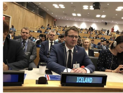
Utanríkisráðherra var viðstaddur kosninguna í mannréttindaráðið. STJÓRNARRÁÐID.