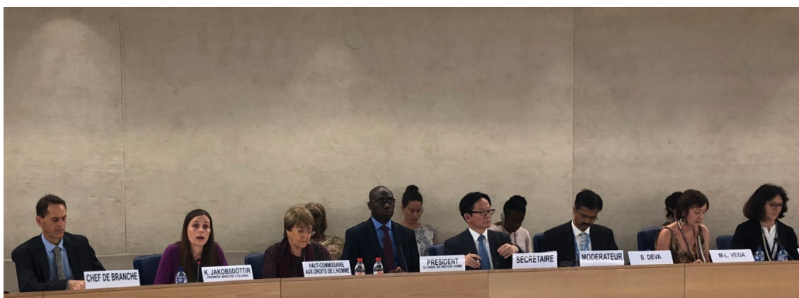
Katrín Jakobsdóttir forsætisráðherra og Michelle Bachelet, mannréttindafulltrúi Sameinuðu þjóðanna, tóku þátt í sérstakri málsstofu mannréttindaráðsins um baráttuna gegn kynbundnu ofbeldi á vinnustöðum.

Katrín Jakobsdóttir forsætisráðherra tók þátt í störfum mannréttindaráðsins að þessu sinni og var það í fyrsta sinn sem íslenskur forsætisráðherra tók þátt í starfi ráðsins.